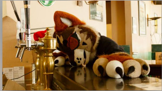
Suiter: Crash